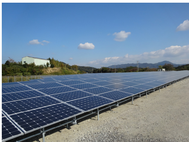
兵庫県南あわじ市

さらに、近年、都市部での高齢者人口増加に伴う介護施設不足が深刻化するなかで、地方の介護施設への役割期待が高まっており、当社は、全国各地の地域に密着した高齢者介護施設（有料老人ホームやサービス付高齢者向け住宅）の受託を積極的に進めております。新生銀行では、医療・ヘルスケアを重点分野の一つとしておりますが、当社もグループの一員として蓄積した専門的なノウハウを活用・提供し、地域でのヘルスケアビジネスのさらなる発展に貢献してまいります。